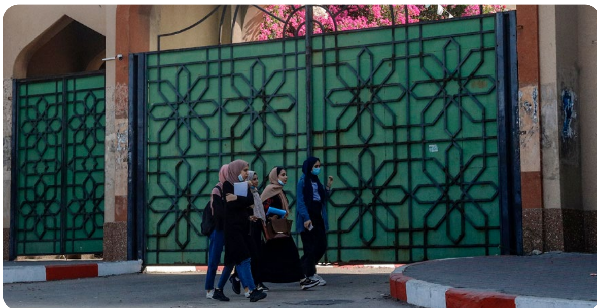
סטודנטיות בכניסה לאוניברסיטה האסלאמית בעזה.

נשים פלסטיניות שמענן הרשום הוא בגדה המערבית ועברו להתגורר בעזה בעקבות נישואים לתושב הרצועה, לא רק מופרדות מבני ובנות משפחתן בגדה על ידי "מדיניות הבידול", אלא עלולות לאבד את מעמדן כתושבות גדה. בשנים האחרונות גישה עד לשימוש גובר בפרקטיקה של החתמת פלסטיניות תושבות הגדה על טפסים המהווים, לטענת ישראל, ויתור רשמי על זכויות בסיסיות, ביניהן על זכות בסיסית של תושב מוגן – הזכות לחזור לביתו בשטח הכבוש.