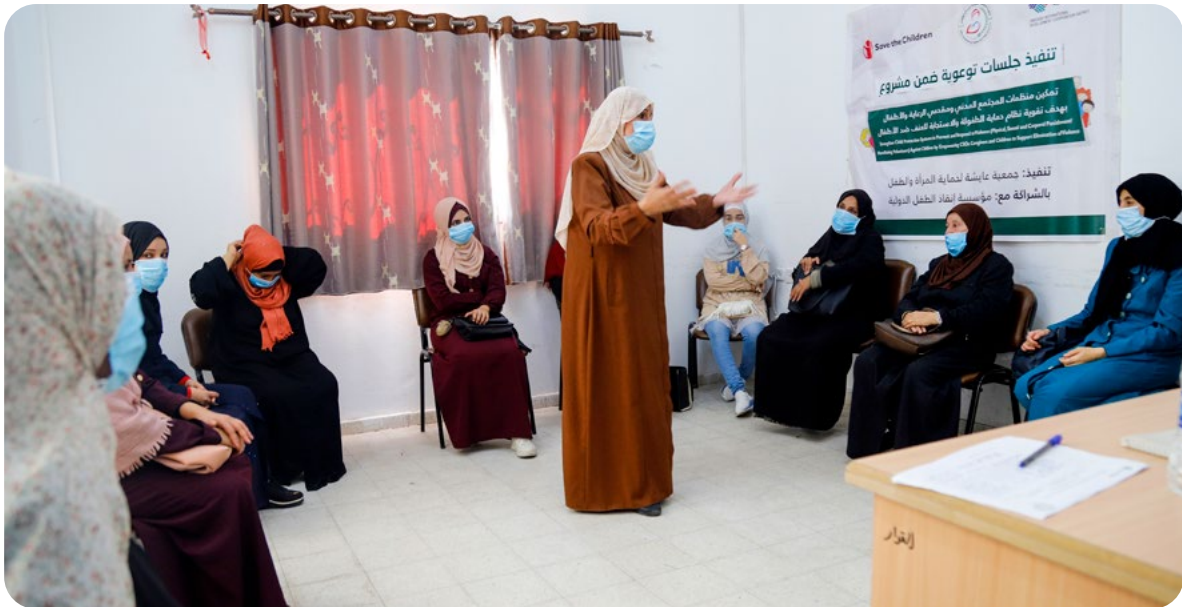
סדנה על בריאות ואלימות מגדרית של "ארגון עאישה להגנה על נשים וילדים".

מכוח האמנה לביעור כל צורות ההפליה נגד נשים אשר נחתמה באומות המאוחדות בשנת 1979 ונחתמה על ידי ישראל כבר ב-1980. על פי הסעיף הראשון לאמנה, אפליה היא כל "הבחנה, הוצאה מן הכלל או הגבלה על יסוד מין", שתוצאתן או מטרתן, פוגעת בנשים "בתחום המדיני, הכלכלי, הסוציאלי, התרבותי, האזרחי או בכל תחום אחר". המדינות החתומות על האמנה מחויבות להימנע מאפליית נשים; לפעול באופן אקטיבי נגד הפליית נשים; ולנקוט צעדים כדי להבטיח את מלוא ההתפתחות והקידום של נשים (סעיף ד'3-3 לאמנה).