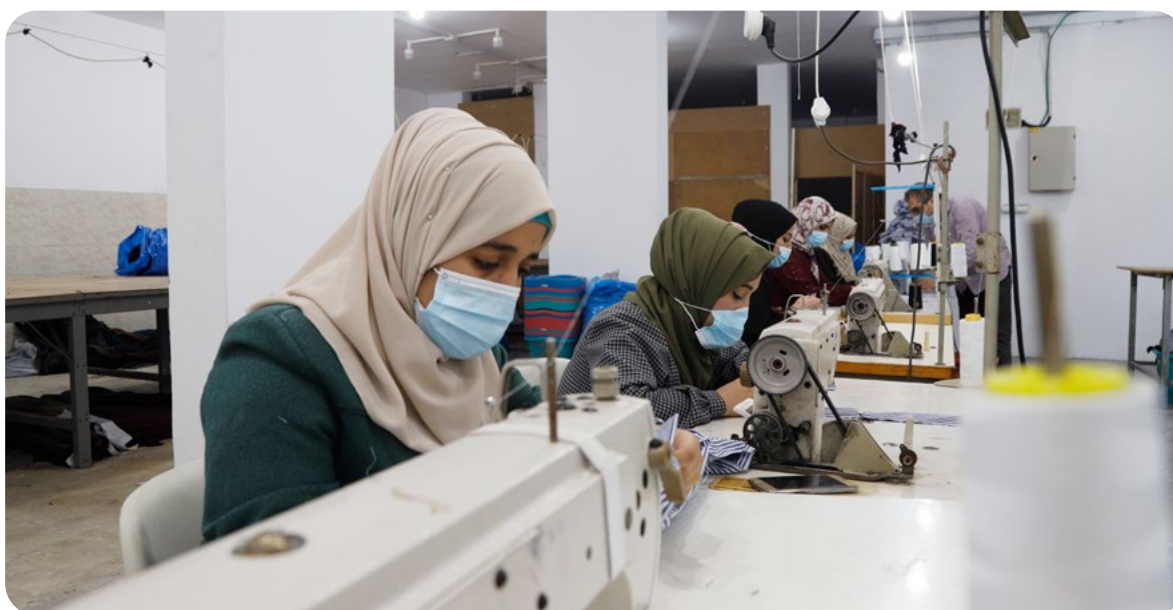
עובדות בחברת ההלבשה אל מאג'ד.

החובה לשמור על שוויון בין נשים לגברים מעוגנת במשפט הישראלי בדברי חקיקה שונים ובהלכה הפסוקה. בחוק שיווי זכויות האישה התשי"א-1951 נקבע כי אין להפלות לרעה נשים בשום פעולה משפטית וכי כל הוראת חוק המפלה לרעה נשים – אין לקיים. עוד קובע החוק כי ניתן לקבוע שקיימת הפליה גם אם היא תוצאה של פעולה שלא היתה בה כוונה להפלות (ס' 1א). החובה שלא להפלות נשים חלה כמובן על מדינת ישראל גם ביחס למשטר ההיתרים שקבעה בסטטוס הרשאות. המשמעות היא, שאם ימצא שסטטוס הרשאות אינו מאפשר לפלסטיניות נגישות להיתרי תנועה, באותה מידה שהוא מאפשר זאת לפלסטינים, אזי ישראל מפלה לרעה נשים בניגוד לחוק, ואין זה משנה כלל אם לא היתה לה כל כוונה לעשות כן.