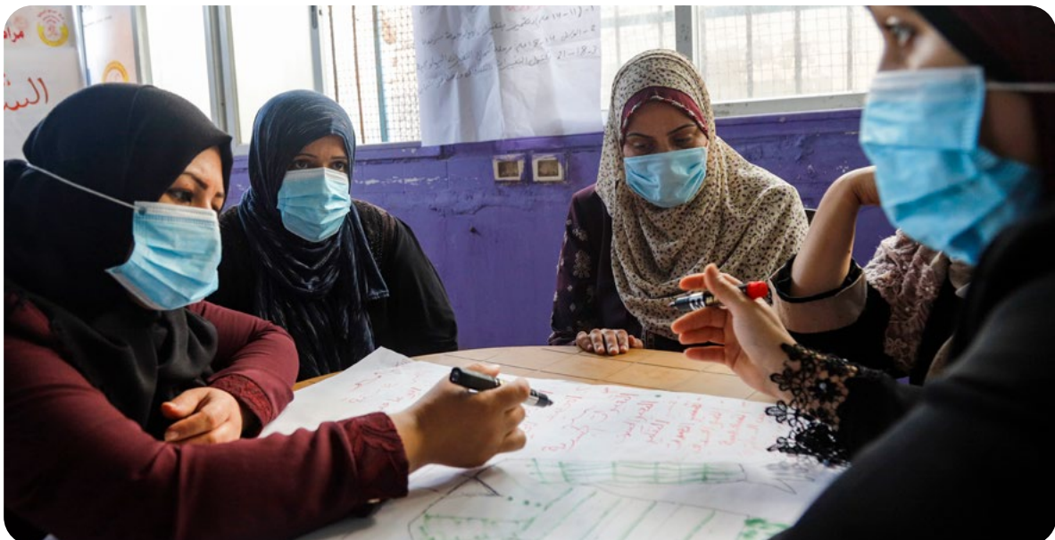
משתתפות בסדנה על בריאות ואלימות מגדרית.

ישראל שולטת על רוב תנועת האנשים והסחורות אל רצועת עזה וממנה, כמו גם על המרחב האווירי והימי שלה, שליטה שמקנה לה השפעה עצומה על כל היבטי החיים של תושביה ותושבותיה. משטר ההיתרים שאוכפת ישראל כאמצעי לניהול האוכלוסייה הפלסטינית החיה תחת שליטתה במרחב שבין הירדן לים, חוסם בפני מרבית הפלסטינים בעזה אפשרות להגיש בקשות להיתרי תנועה בין עזה, ישראל, הגדה המערבית וחו"ל. המעטים והמעטות שרשאים להגיש בקשות לנוע, על פי המדיניות הישראלית, הם מי שעומדים בקריטריונים הצרים שקובעת ישראל. קריטריונים אלה מפורטים במסמך שמפיקה יחידת מתאם פעולות הממשלה בשטחים (מתפ"ש) תחת השם " סטטוס הרשאות בלתי מסווג לכניסת פלסטינים לישראל, למעברם בין אזור יהודה ושומרון לבין רצועת עזה וליציאתם לחו"ל " (להלן "סטטוס הרשאות"). בעקבות פעילות משפטית של ארגון גישה, מסמך זה, המהווה את מדיניותה הרשמית של ישראל בכל הנוגע לתנועת פלסטינים, מתפרסם כיום באתר מתפ"ש. המסמך מתעדכן מעת לעת , לפעמים תוך שינוי קל בקריטריונים המופיעים בו, אך מהותו נותרת בעינה: הגבלה שיטתית וחמורה של תנועת פלסטינים, בידוד פיזי, כלכלי וחברתי של רצועת עזה, וניתוק בין עזה לגדה המערבית ובין האוכלוסיות הפלסטיניות שבכל אזור.